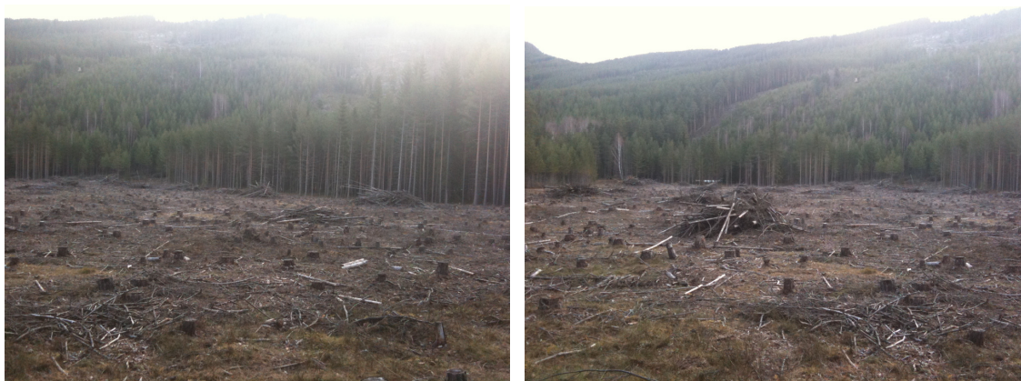
Bilder fra planområdet, gbnr. 78/13.