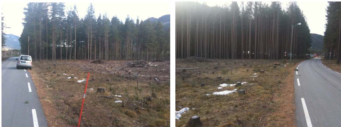
Sikt mot nord (Nesbyen) og sikt mot sør retning Nymoen.